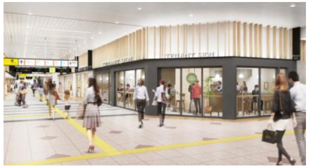
全面開業時改札内コンコース内観イメージ

エキュート大宮 ノースホームページ： https://www.ecute.jp/omiyanorth ※7/1（水）より順次更新