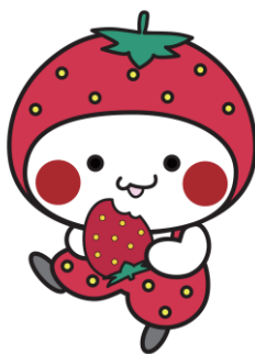
▲「もおかぴょん」出演予定！