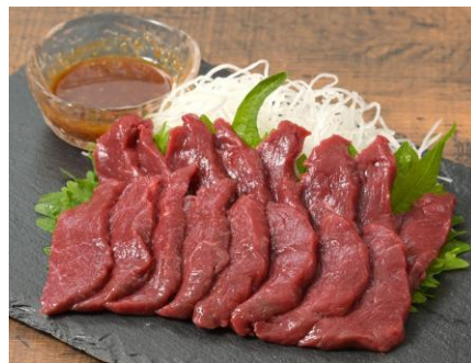
金・土・日限定 【会津】 馬刺し ロース100g ＜馬さしの鈴静＞

とろけるような舌触りで、まさに海のフォアグラと呼ばれる逸品です。日本酒のあてにいかがでしょうか。