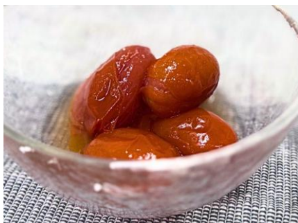
【浜通り】 おこさん とまとのピクルス ＜長久保食品＞

いわき市産のトマトを米酢・出汁・醤油を使いピクルスにしました。彩りがよく、付け合わせやサラダやマリネにいれるのもおすすめです。