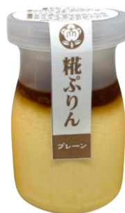
日替り限定 【中通り】 糀プリン ＜糀和田屋＞

とても柔らかくしつかりとした味わいの赤身の王様。会津の馬刺しは赤身でとても柔らかくニンニクの効いた自家製のタレをつけて食べるのが特徴です。