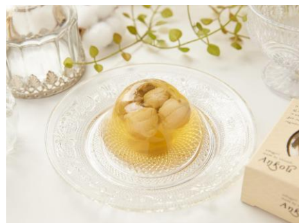
【浜通り】 金曜日の煮凝り あんこう ＜おのざき＞

いわき市産のトマトを米酢・出汁・醤油を使いピクルスにしました。彩りがよく、付け合わせやサラダやマリネにいれるのもおすすめです。