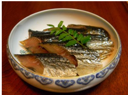
【会津】 にしん山椒漬スライス70g ＜会津高砂屋＞

会津伝統の技で仕込んだにしんの山椒漬け。じっくりと乾燥させた身欠きにしんに、山椒の風味が調和した逸品です。