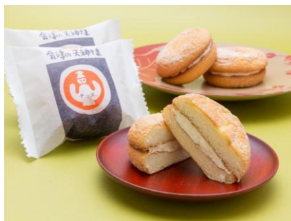
【会津】 会津の天神さま チーズ ＜お菓子の蔵 太郎庵＞