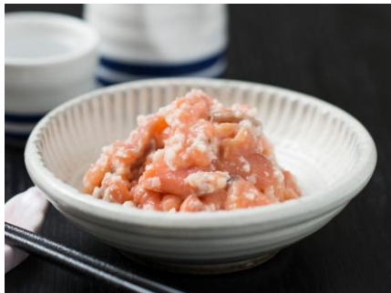
【中通り】 阿武隈の紅葉漬 ＜福島紅葉漬＞

会津伝統の技で仕込んだにしんの山椒漬け。じっくりと乾燥させた身欠きにしんに、山椒の風味が調和した逸品です。