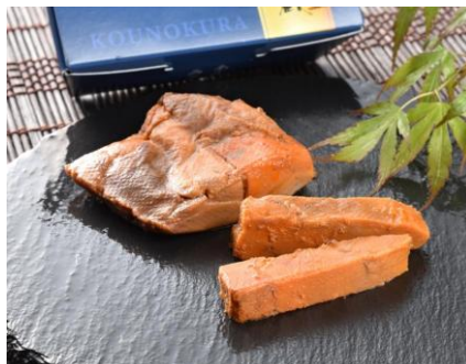
【浜通り】 あん肝のみそ漬 ＜みそ漬処 香の蔵＞

福島県沖の常磐ものあんこうを丁寧に煮込んだ煮ごり。コラーゲン豊富でぶるっとした上品な口当たりが特長です。