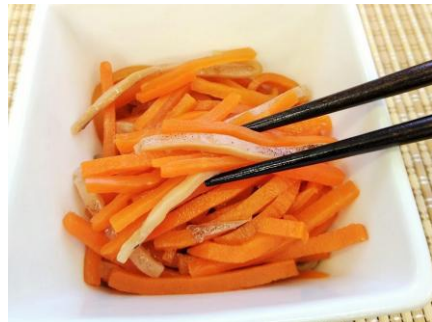
【中通り】 いつものつけもの いか人参 ＜香精＞

鮭を糀と塩で漬け発酵熟成させる伝統の製法。鮭の旨みと糀の芳醇な香りが際立ち、お酒やご飯に合う一品です。