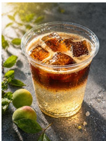
梅コーヒースパークリング