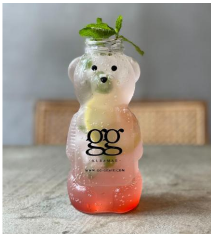
レモネードソーダ

爽やかな梅の酸味とコーヒーのほろ苦さが炭酸とともに広がる、初夏にぴったりのスパークリングドリンク。すっきりとした後味をお楽しみください。