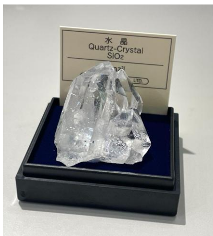
ミニ鉱物標本 水晶