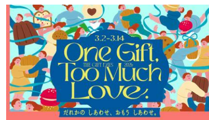
※第三弾ビジュアルイメージ