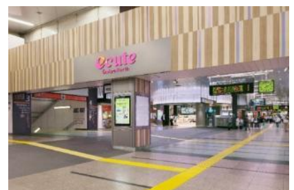
※イメージ（エキュート大宮 ノース）

「NAKAMISE HOPPING～賑わいや路地裏感が楽しいエキナカ商店街～」をコンセプトに、2020年7月、エリアが生まれ変わりました。通勤・通学だけでなく、旅行や出張、帰省など新幹線が発着する駅ならではの長距離移動のお客さまにも便利にご利用いただけるショップが並びます。