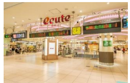
※イメージ（エキュート大宮）

エキュート大宮のコンセプトは、「マーケットアベニュー」。幅広い利用シーンに応えられるような、デイリー性の高い食物販から服飾雑貨まで、駅コンコースにバラエティ豊かなショップが軒を連ねています。賑やかなエキナカを気軽に散策しながらお気に入りのアイテムを発見する楽しみをお客さまに提案します。