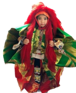
※歌舞伎衣裳・かつら体験イメージ (子ども)