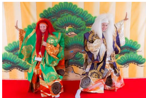
※歌舞伎衣裳・かつら体験イメージ (大人)