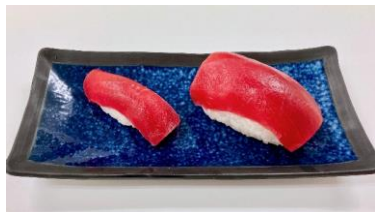
<参考> 左：現代の握り寿司 右：江戸時代の握り寿司 大きさの比較イメージ