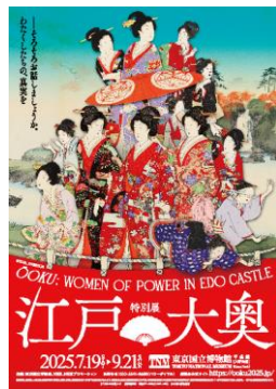
※特別展「江戸☆大奥」イメージ