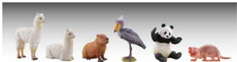
造形総指揮:松村しのぶ