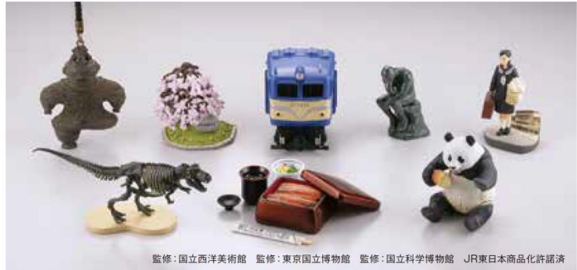
監修：国立西洋美術館 監修：東京国立博物館 監修：国立科学博物館 JR東日本商品化許諾済