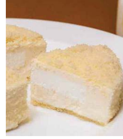
【パティスリーヤナギムラ】

鹿児島産さつまいも使用のスイートポテト専門店。素材の甘さが引き立つ味わいが絶妙。モンブランやクレープなども人気。