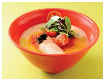
エキュート品川 サウス