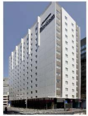
JR九州ホテルブラッサム博多中央