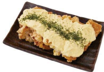
エキュート品川 サウス