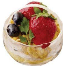
エキュート品川 サウス