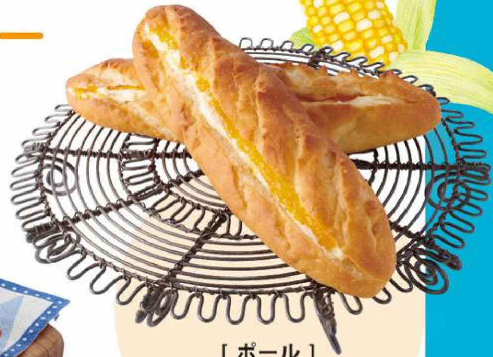
[ ポール ] ヴィエノワ・クレーム(ムロン) 1個 345円(税込)