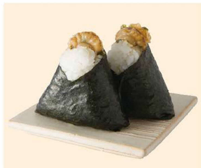
[ おむすび・お味噌汁 ] ほんのり屋 北海道産ほたての ねぎみそ焼きむすび 1個 240円(税込)