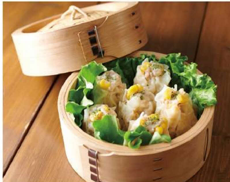
【パオ パオ】 じゃがバタコンシューマイ 6個入 680円(税込)