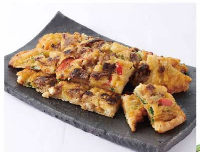
【ハンビジェ デリ】 牛ブルコギチヂミ 1パック 864円(税込)