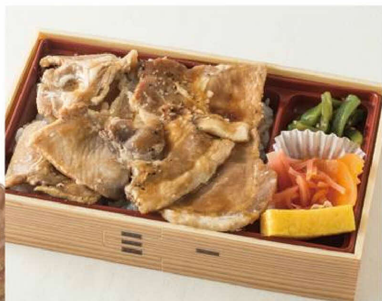
【駅弁屋 旨囃門】 摩周の豚丼 1折 1,080円(税込)