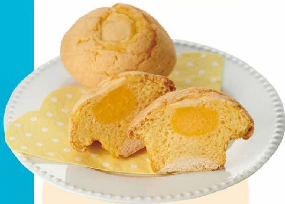
[ ベーグル & ベーグル マイスタイルプラス ] 北海道メロン 1個 280円(税込)