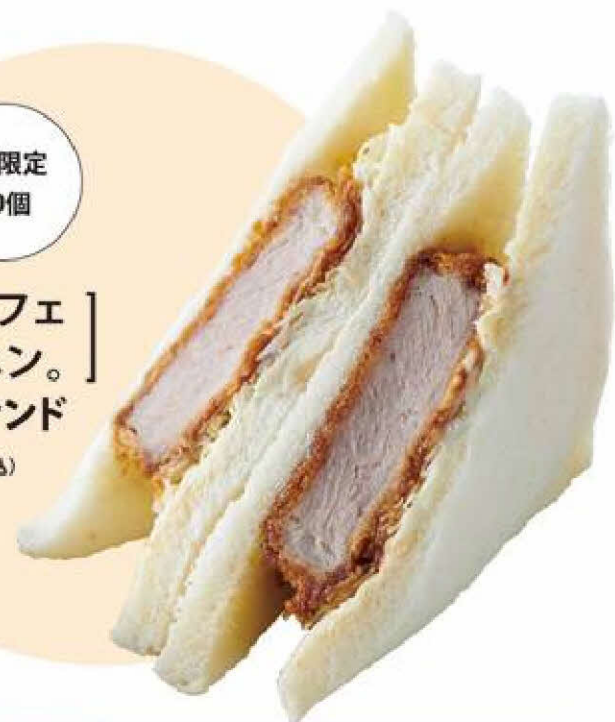
1日限定 50個 [ サンドイッチカフェ ] おいしいメルヘン。 十勝産ヒレカツサンド 1パック 583円(税込)