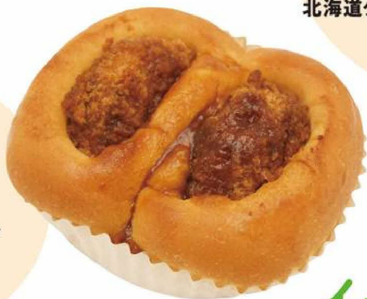
[ 銀座木村家 ] ソースたっぷり 北海道コロッケパン 1個 248円(税込)