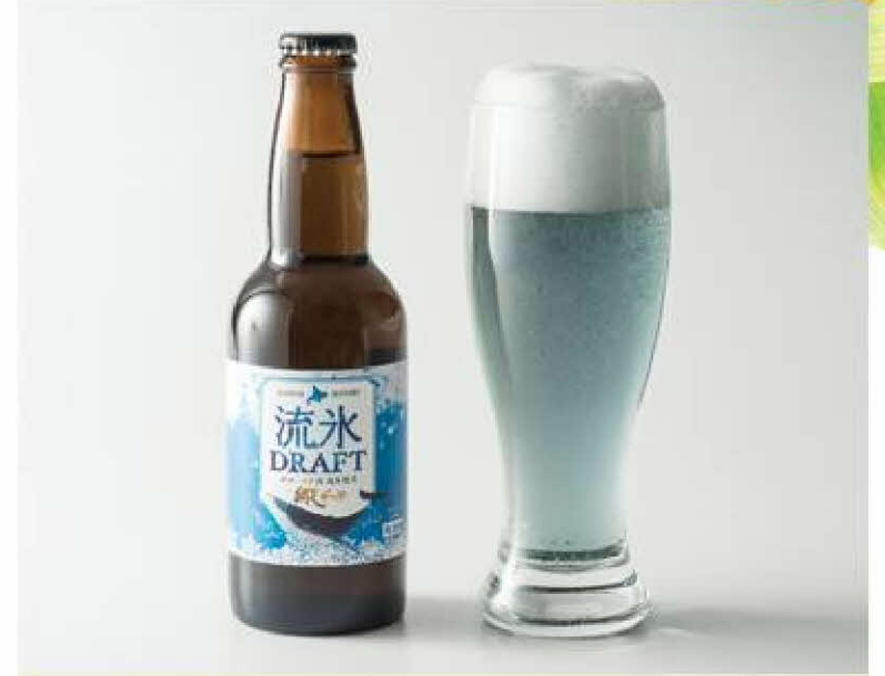
【フーズステージ キタノ フォア】 網走ビール流氷ドラフト 330ml 540円(税込)