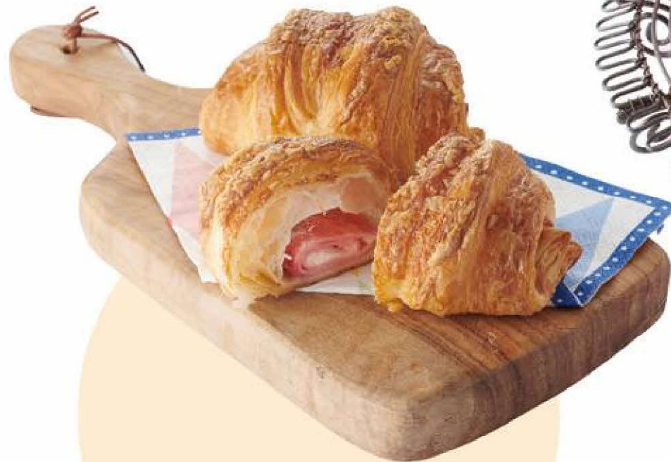
[ 神戸屋 スタッツォ ] 北海道クリームチーズとハムのクロワッサン 1個 292円(税込)