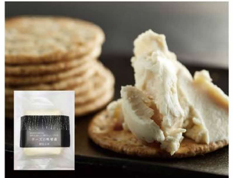
【銀座若菜】 チーズの味噌漬 1個(130g) 1,047円(税込)