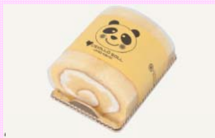
エコール クリオロ

クリオロ・ロール・プレーン 世界コンクール最優秀味覚賞受賞のサントスシェフが、こだわって創り上げた極上ロールです。