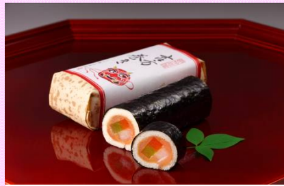
宗家 源 吉兆庵

吉方巻 具に見立てたやわらかな求肥・色あざやかな羊羹・白あんを、スポンジケーキで巻きました。