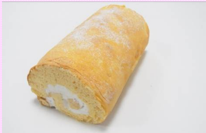
レ・パティシエール

ふわふわ上野ロール 那須の御養卵とフランス産はちみつをたっぷりを使用した、ふわふわのロールケーキです。