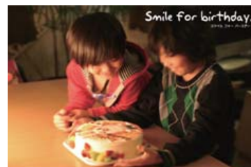
【バースデーケーキをプレゼント】

またこの他、支援金のうちの一部は被災された子どもたちの力になることを祈り、あしなが育英会の「あしなが東日本大地震・津波遺児基金」に寄付いたします。