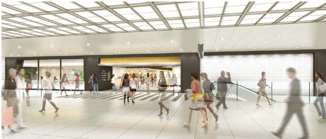
八重洲側(イメージ)